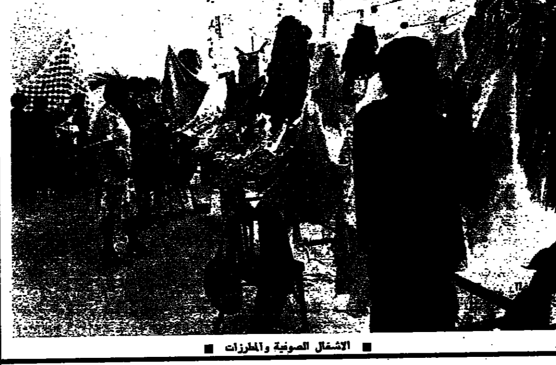
الاشغال الصوفية والمخرزات